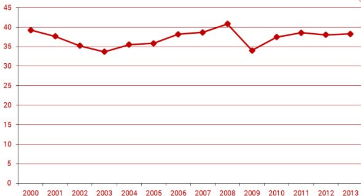
Import towarów i usług (% of GDP)